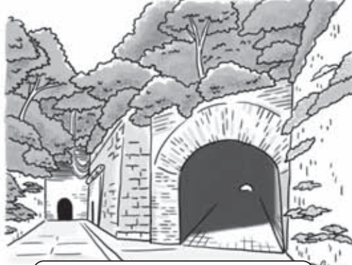
【猿島公園】 横須賀市猿島1 (三笠桟橋より船で約10分)

レク・ガイド 無人島・猿島航路乗船料:レク・ガイド2016「施設割引利用券」を利用して一般料金の1割引、別途猿島公園入園料大人200円・小人100円の負担あり