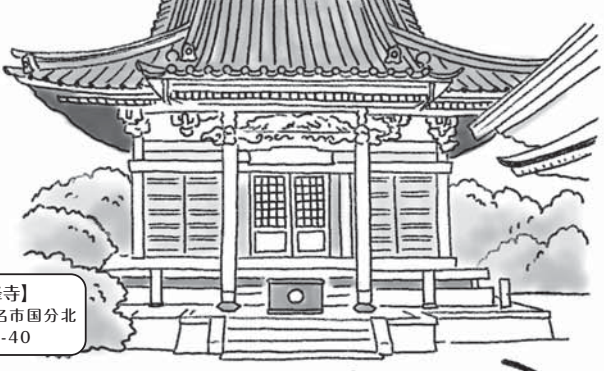
【龍峰寺】 海老名市国分北 2-13-40

龍峰寺 鎌倉の建長寺の末寺として室町時代に創建。仁王門、仁王像、観音堂、絵馬など、貴重な文化財が多数あります。