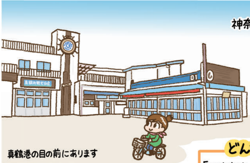
真鶴港の目の前にあります

禁無断転載 取材・イラスト/川瀬ホシナ https://hoshi-port.com