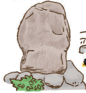
【貴船神社】 足柄下郡真鶴町真鶴1117 9:00~16:00 ①なし

約1200年前に、三ツ石の沖に現れた船の中で見つかった木像12体と書状を祀ったのが起源。今年の7月28、29日は日本三大船祭りのひとつ「貴船まつり」が行われ、華やかな小早船を見ることができ、町が活気づきます。