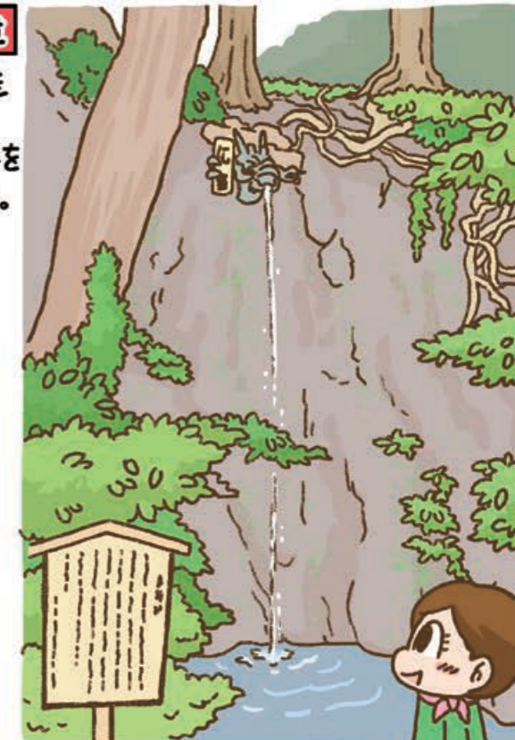
【良弁滝】 伊勢原市大山471 ⑨24時間

奈良の東大寺、そして大山寺を開いた僧・良弁が水行を行ったといわれる滝。3mほどの高さから細く流れ落ちる水の音が心地良い。江戸時代、滝に打たれる人々の様子を葛飾北斎などが浮世絵に描き、人気スポットとなりました。